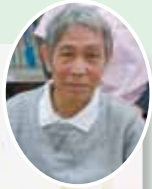
訪問看護ステーションのむら