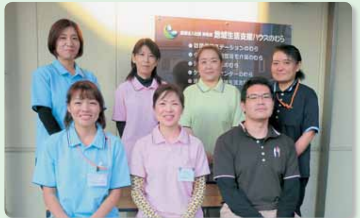
デイサービスのむら