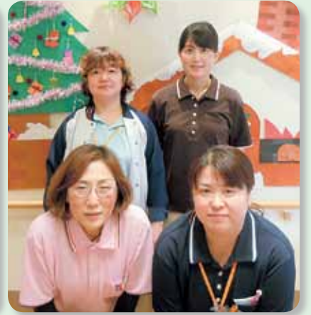
小規模多機能型居宅介護のむら