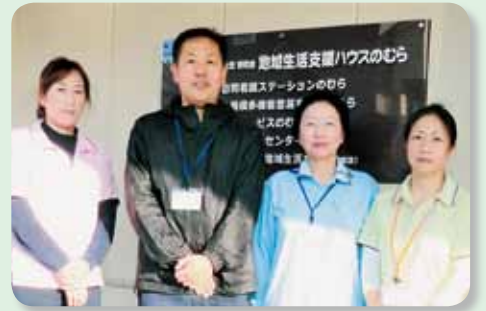
ケアプランセンターのむら 地域生活支援・地域交流