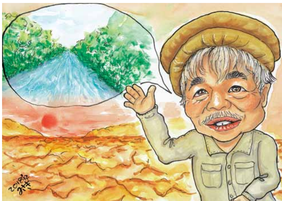
アフガンに命の水を

年末年始の診療は上記の通りとなっております。休診に際しましては、ご迷惑をおかけいたしますが、ご協力お願いいたします。