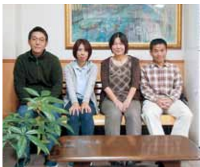
尼崎市「中央東」地域包括 支援センターのみなさん

「中央東」地域包括支援 センターは、尼崎市からの 委託を受け、平成十八年か ら運営しています。尼崎市 では六つの日常生活圏域に 二か所ずつの計十二か所あ ります。職員は看護師、社 会福祉士、主任ケアマネジ ャーの資格を持つ専門職四 人で、地域の高齢者人口に よって人員配置が決められ ています。主な業務は、① 地域の高齢者の様々な相談 を受ける「総合相談」、② 高齢者虐待の早期発見・防 止や悪質商法などの被害防 止・対応等の「権利擁 護」、③要支援認定の方の ケアプランの作成、高齢者 対象の介護予防教室の開催 等の「介護予防ケアマネジ メント」、④高齢者を地域 で支える連携体制をつくる 「包括的・継続的ケアマネ ジメント」の四つです。