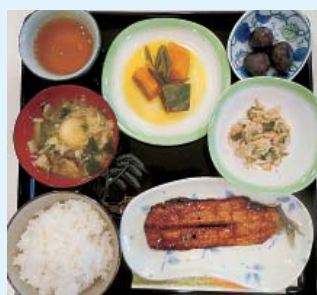
もやしとわかめのごま酢和え