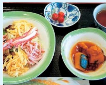
かぼちゃのいとこ煮