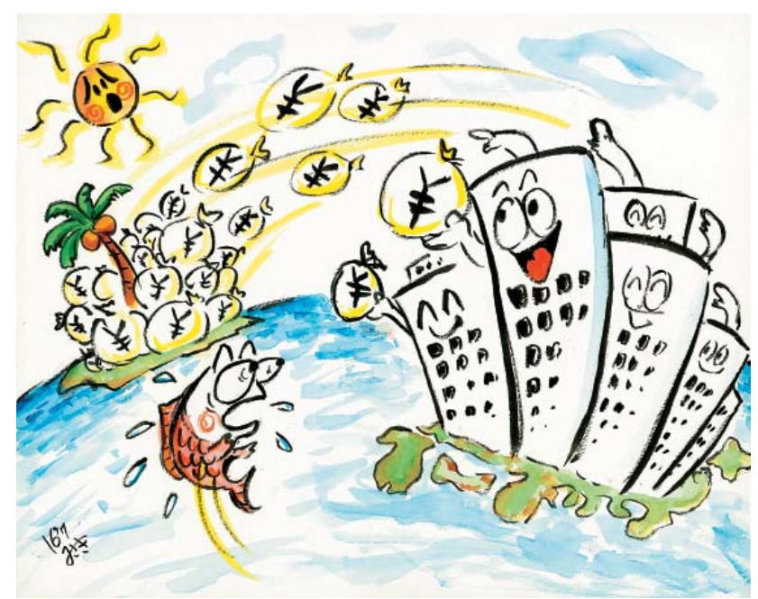
税金のがれはケイマンで みさき漁